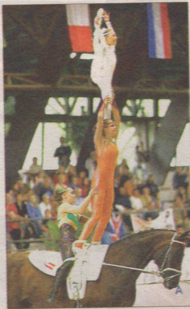
Die Zillertalerinnen waren eine Klasse für sich.