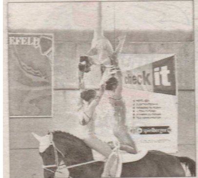
Tiroler Voltigiererrinnen beherrschen ihre Kunst.

Voller Erfolg für das Voltigier-Juniorenteam der VV Zillertal auf dem Pferd Viva Alegria und mit Longenführerin Jaqueline Helm. Mit einem Sieg am Wochenende beim Turnier in Markt-Graf-Neusiedl qualifizierten sich die Tirolerinnen für die Junioren-EM in Ungarn. Tirol als Mannschaft erreichte den 2. Platz hinter den Niederösterreicherinnen.