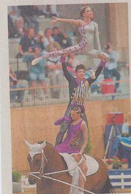
Triumphierten in Schweden: die Reiter von der TU Schwaz.